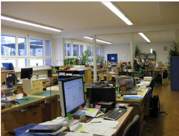
Lehrerarbeitsplatz im Lernatelier

Im Lernatelier haben auch die Lehrpersonen einen Arbeitsplatz. Diejenigen Lehrpersonen, die keine Inputlektionen erteilen, arbeiten im Lernatelier entweder als Aufsichts- und Ansprechperson oder verrichten Arbeiten der Vor- und Nachbereitung. Die Zusammenarbeit zwischen Lehrpersonen wird hier unmittelbar auch für die Jugendlichen sichtbar. Teamteaching wird ohne grossen Aufwand möglich.