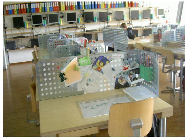
Einzelarbeitsplatz eines Jugendlichen Schule Bürglen TG

Für die Inputlektionen verlassen die SuS das Lernatelier. Inputlektionen können sowohl vom inhaltlichen oder zeitlichen Rahmen wie auch von der Gruppenzusammensetzung sehr variabel gestaltet werden. SuS, die nicht an Inputlektionen teilnehmen, arbeiten selbstständig im Lernatelier. Somit entfallen Zwischenstunden.