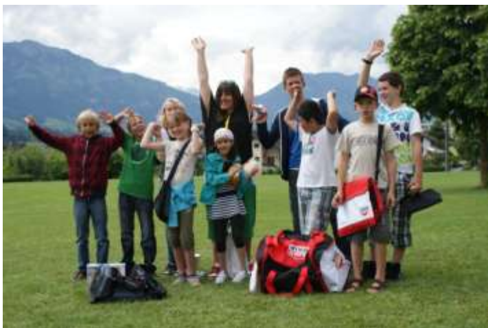
Gross und Klein am Aktivtag