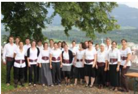
Das MS-Team auf dem Landenberg