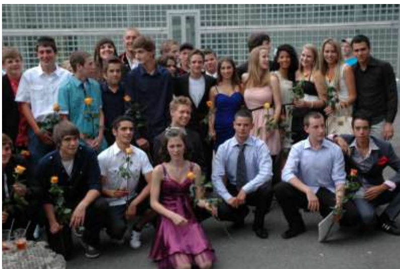
Abschlussfeier 3. KOS